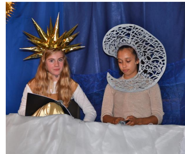
Erzählerinnen als Sonne und Mond