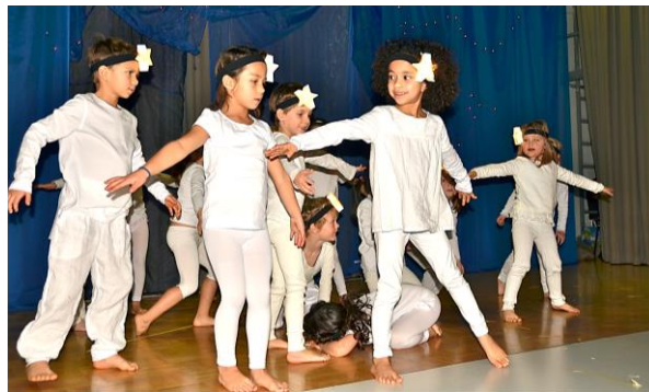
Tanz der Vorschulkinder

Die Vorschulkinder können noch nicht gut 3 Stunden am Stück seriös proben. Sie haben deshalb ihr eigenes Programm, üben aber einen Tanz ein, der im Stück normalerweise zweimal vorkommt. Daneben haben sie meistens noch einige kleine Auftritte, bei denen sie über die Bühne sausen. Selbstverständlich kann der Tanz aber auch von älteren Kindern übernommen oder die Sternenschar als normale Schauspiel-Rollen besetzt werden.