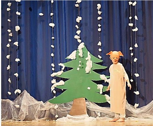
Schneeketten sind gute Füllarbeiten – Tipp: Aufbewahren, sie geben viel zu tun!

Bei allen Bühnen sind die Voraussetzungen ein bisschen anders. Mal ist die Infrastruktur besser, mal weniger ausgeklügelt.