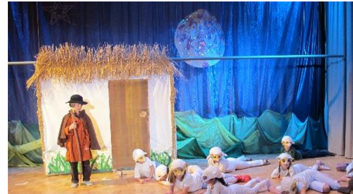
Hinter dem Vlieshimmel wird die Sonne zum Mond...