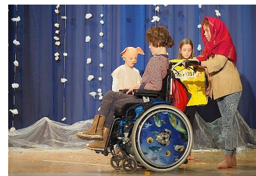
Verzweifelt schiebt sie einen Rollstuhl - statt: Im Arm trägt sie ein Kind

Bei fast allen Stücken kann mit minimaler Textanpassung ein relativ schwer behindertes Kind eingebaut werden. Joseph, einer der Hirten oder das Jesuskind eignen sich da besonders gut. Kein Mensch stört sich am Christkind oder einem Joseph im Rollstuhl. Die Eltern dieser Kinder sind oft zu enorm viel Unterstützung und Hilfe bereit, damit das Mitwirken ihres Kindes möglich wird. Und das Publikum dankt es einem auf jeden Fall! Es braucht ein Theaterkind, das bereit ist, den Rollstuhl zu stossen oder das Kind an der Hand zu nehmen und zu führen.