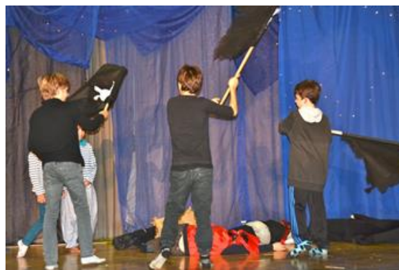
Pirantanz der Bühnenbauer

Viele Kinder ab der 5. Klasse stehen nicht mehr so gerne vorne. Trotzdem möchten sie beim Theater noch mithelfen. Sie sind für die Herstellung der Kulissen und den Bühnenumbau zwischen den Szenen verantwortlich. Oft stehen sie dann am Schluss doch gerne für eine winzige Rolle noch auf der Bühne – Figuren, die nur ganz am Rand oder sehr kurz vorkommen.