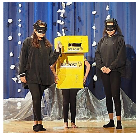
Krähen und Briefkasten-Solo

Die Theaterkinder spielen ihre Rollen pantomimisch. Um genug Rollen für alle Kinder zu haben, werden oft auch Details aus dem Bilderbuch belebt. Die Bäume des Waldes, Briefkästen, Hühner, Raben und Vogelscheuchen... Ein Solo-Lied oder ein kleiner Tanz können diese Rollen zu richtigen kleinen Perlen im Stück machen.