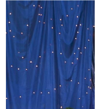
...und tausend Sterne funkelten am Himmel