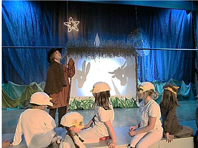
Das Geschehen im Stall als Schattenspiel

Es kann ein sehr wirkungsvolles Gestaltungselement sein, das Geschehen im Stall, im Haus, im Hotel, ... als Schattenspiel darzustellen.