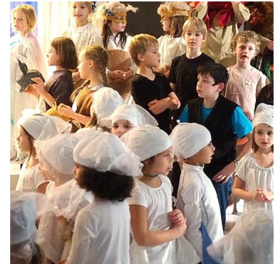
Selber Zuschauen statt Warten hinter der Bühne

Der Chor sind jeweils alle Kinder zusammen, auch Bühnencrew und Tänzer*innen. Dadurch gibt es kein „hinter der Bühne“. Die Kinder treten aus dem Chor neben der Bühne ins Rampenlicht und kehren in den Chor zurück. So können sie beim Stück zuschauen, wenn sie nicht selber auf der Bühne stehen und werden immer wieder aktiv mit Singen.