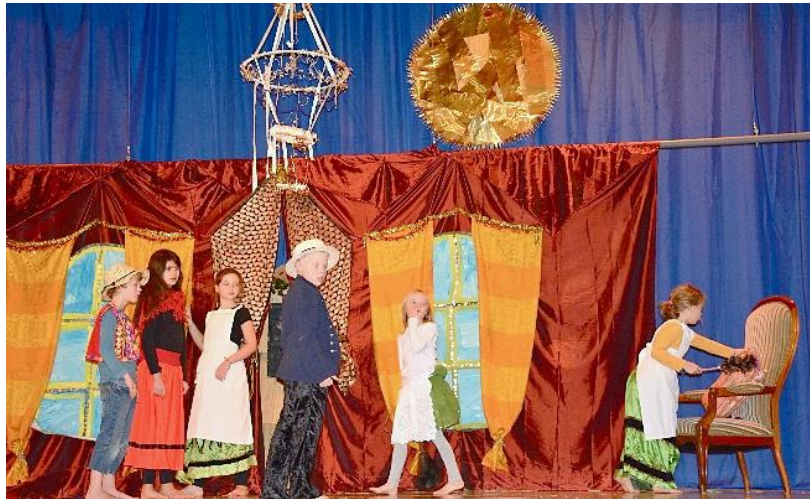
Das Herrenhaus am Reservezug deckt den fix montierten Stall ab

Für ein zweites Bild ist mancherorts ein Reservezug vorhanden, der einfach beim Szenenwechsel heruntergelassen werden kann. Wo das nicht möglich ist, können zweite Bilder auch an einem Seil vor dem Himmel aufgehängt werden.