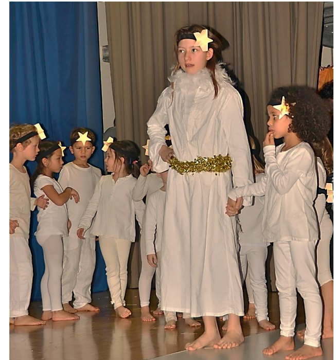
Der kleine Stern zieht voraus