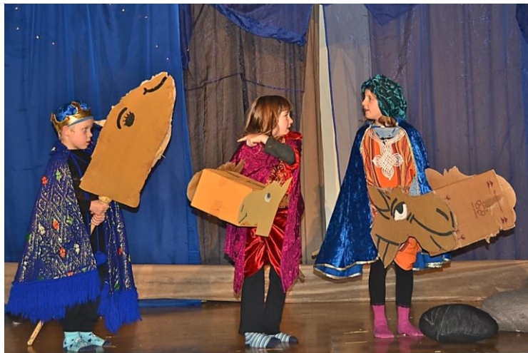
Die langsamen Sterndeuter und ihre schwierigen Kamele

Erfahrungsgemäss spielen Kinder aber gerne Tiere oder Rollen, die eine Art Clown-Funktion haben und alles pantomimisch „kommentieren“ können - wie hier im Stück die Sterndeuter und ihre Kamele.