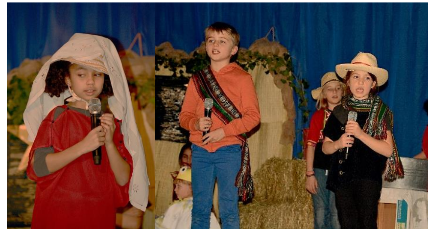
Solist*innen – Miks helfen!