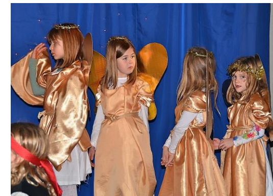
Aus 1 mach 4

Kinder spielen gerne Tiere. Neue Rollen können auch durch Hinzufügen von Tieren geschaffen werden. Hunde und Kamele, die mitlaufen, ein Kalb bei der Kuh, oder wie hier aus einem Engel werden vier... Dazu sind manchmal Textanpassungen nötig.