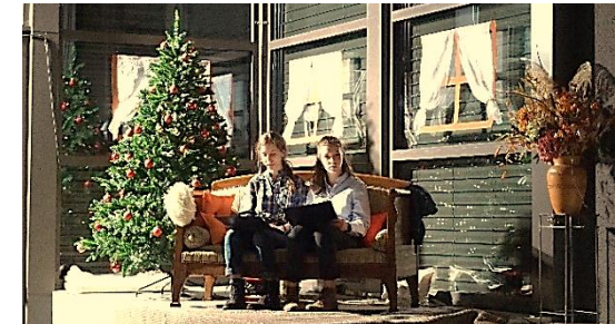
Erzähler*innenecke hier als Bauernstube

Die Erzähler*innen haben ihre eigene kleine Bühne am Rand und sind als Rollen eingebaut ins Ganze des Stückes. Sie sollten nach Möglichkeit einen Blick auf die Bühne haben, weil sie manchmal mit Weiterlesen auf das Theater warten müssen. Sie erzählen die Geschichte und stellen sich dem Publikum in einem eigenen kleinen Vorspiel vor. Für das Vorspiel gibt es eine inhaltliche Vorgabe, die Rollen müssen aber selber entwickelt und gefüllt werden.